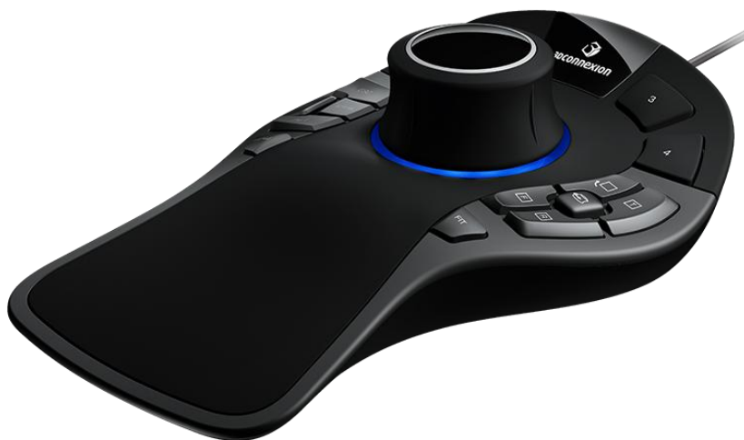
3D-манипулятор SpaceMouse Pro